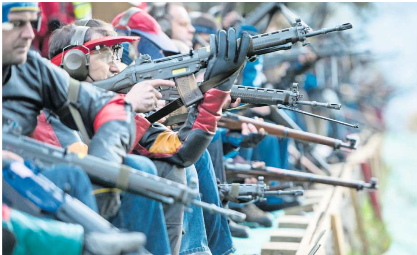
Anpassungen des Waffenrechts lassen in der Schweiz zuverlässig die Emotionen hochgehen.