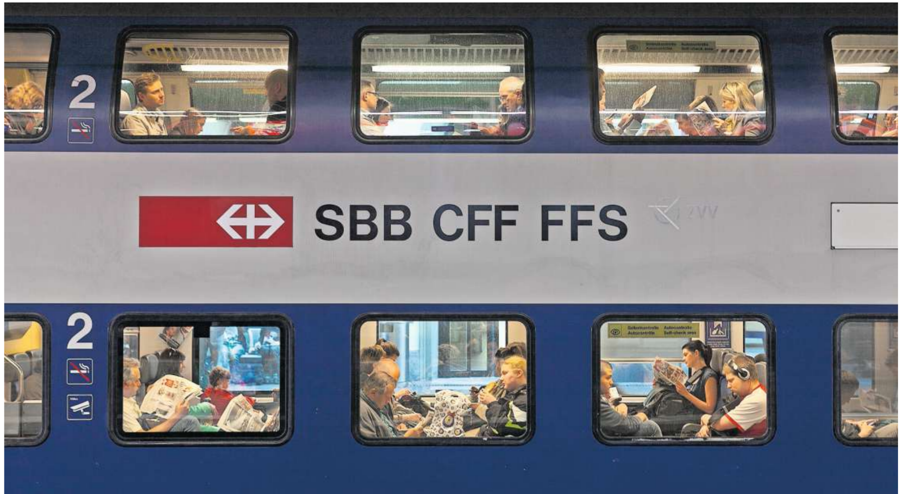
Noch mehr Passagiere: Der Bundesrat geht davon aus, dass die Nachfrage im öffentlichen Verkehr weiter steigt.