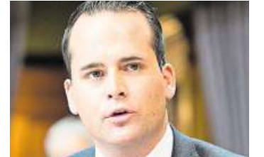
Damian Müller Luzerner Ständerat (FDP)

etappierbar. Zudem können die Züge weiterhin in Thalwil halten. Nachteil ist, dass der Fahrzeitgewinn nur 1 bis 2 Minuten beträgt (mit dem Basistunnel bis 6 Minuten) und der Bahnhof Thalwil ausgebaut werden muss. Dieser Ausbau ist in der Kostenschätzung des Komitees enthalten.